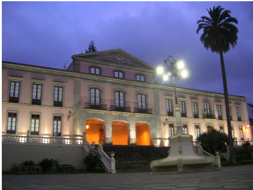
Rathaus in La Orotava ( Punkt A , Treffpunkt)