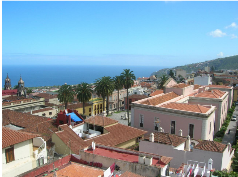
Blick von schräg hinten auf das Rathaus – die Straße führt hinter den Palmen vorbei